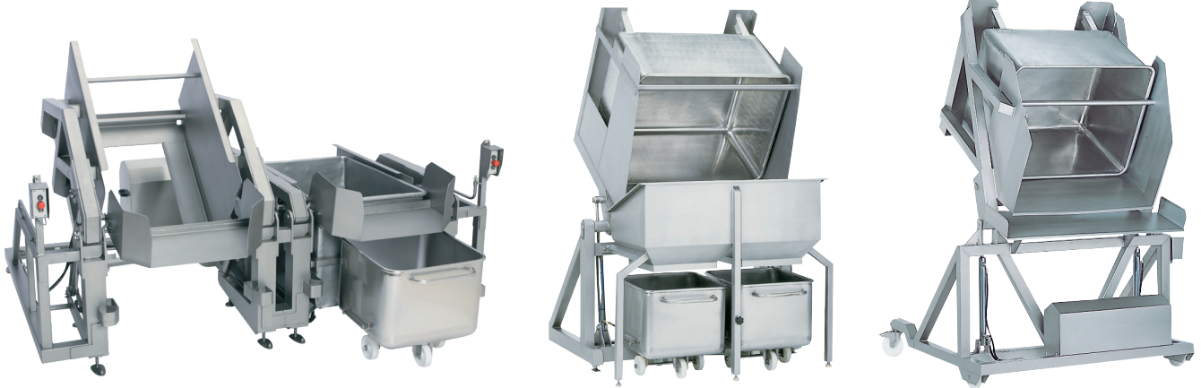
Doppel-Swing-Loader Typ 27200