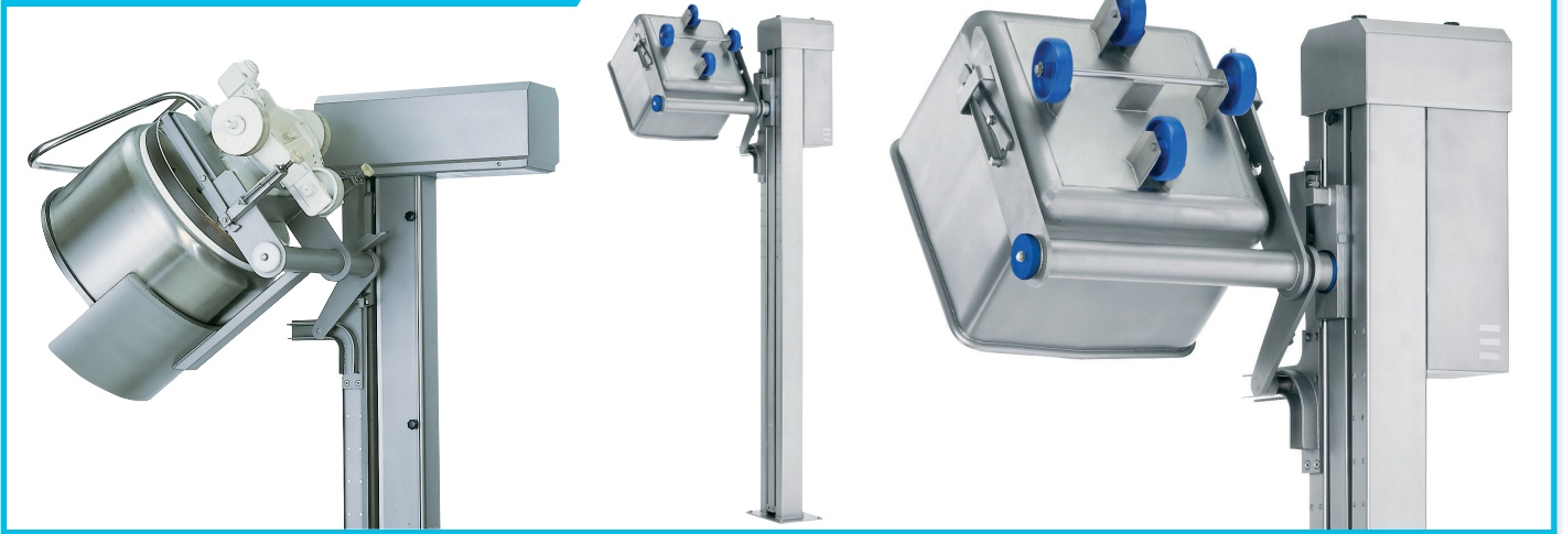
Hebe- und Kippvorrichtung Typ 27000